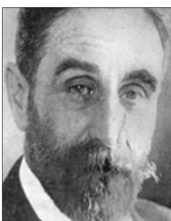
Irlantilainen Roger Casement tutki ihmisoikeusrikkoksia ja ajautui seksiskandaaliin.

Oikeudenkäynnissä väännettiin kättä, voiko Casementia ylipäätään syyttää rikoksista