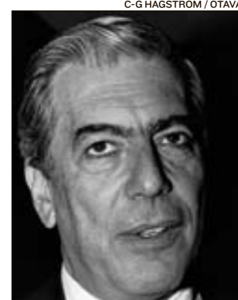
Perulainen nobelisti Jose Vargas Llosa julkaisi romaanin Roger Casementista.