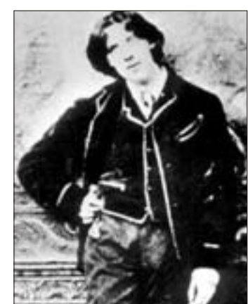
Oscar Wilde istui samassa vankilassa kuin missä Julian Assange oli pidätettyinä.