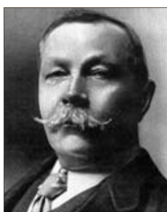
Kirjailija, ihmisoikeustaistelijana Arthur Conan Doyle tuki Roger Casementia.

Edward Carsonista tuli oikeudenkäynnin ansiosta kuuluisa ja pohjoisirlantilaisen unionistien sankari. Hän taisteli Irlannin pitämistä osana Britanniaa. Nykyisin Carsonin kunniaksi veistetty patsas seisoo käsi kurkottaen kohti taivasta Pohjois-Irlannin parlamentin Stormontin edessä Belfastissa.